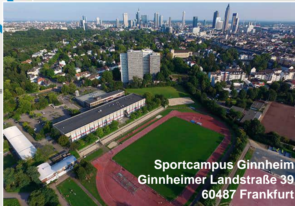
Sportcampus Ginnheim Ginnheimer Landstraße 39 60487 Frankfurt