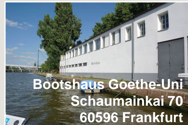
Bootshaus Goethe-Uni Schaumainkai 70 60596 Frankfurt